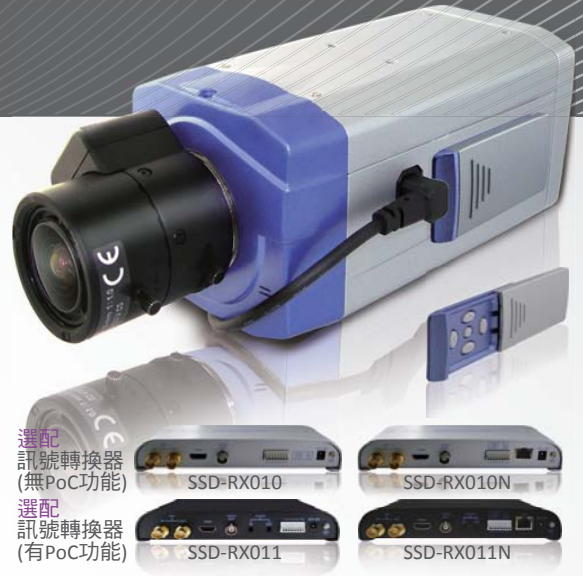
選配訊號轉換器 (無PoC功能) 選配訊號轉換器 (有PoC功能)